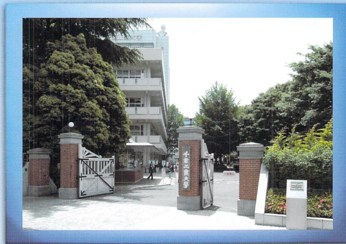
千葉工業大学通用門（国登録有形文化財）